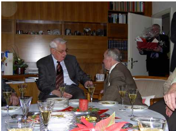
Erfahrungsaustausch und Geschenkübergabe