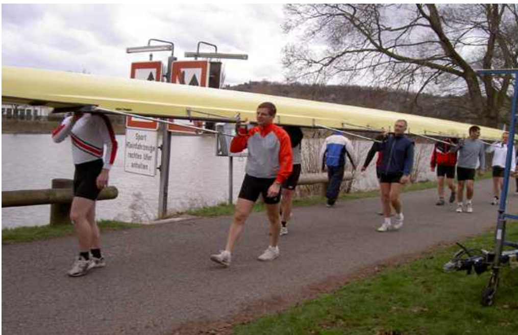
Canstatter Kanne (Bericht S.8)